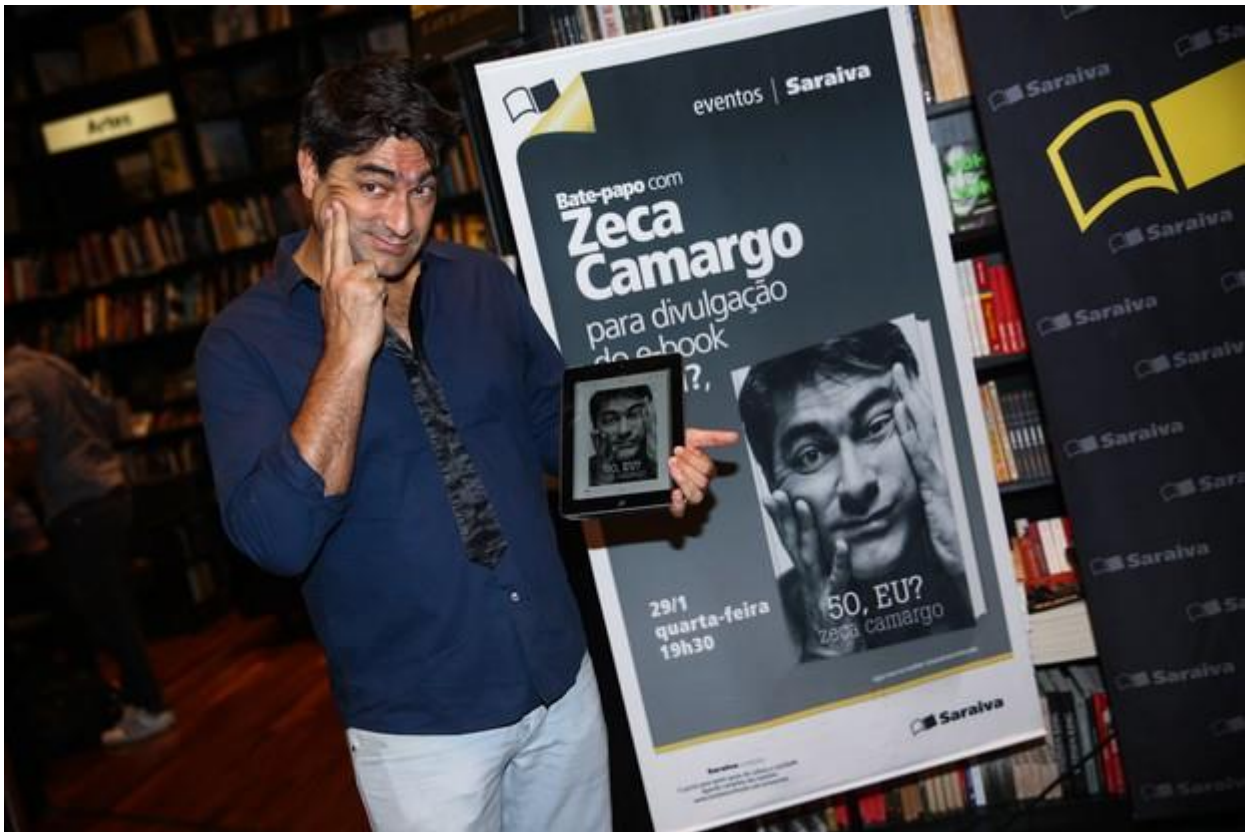
Zeca Camargo