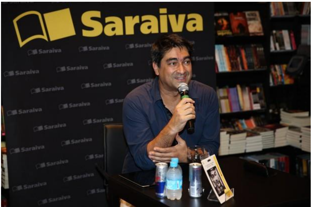
Zeca Camargo