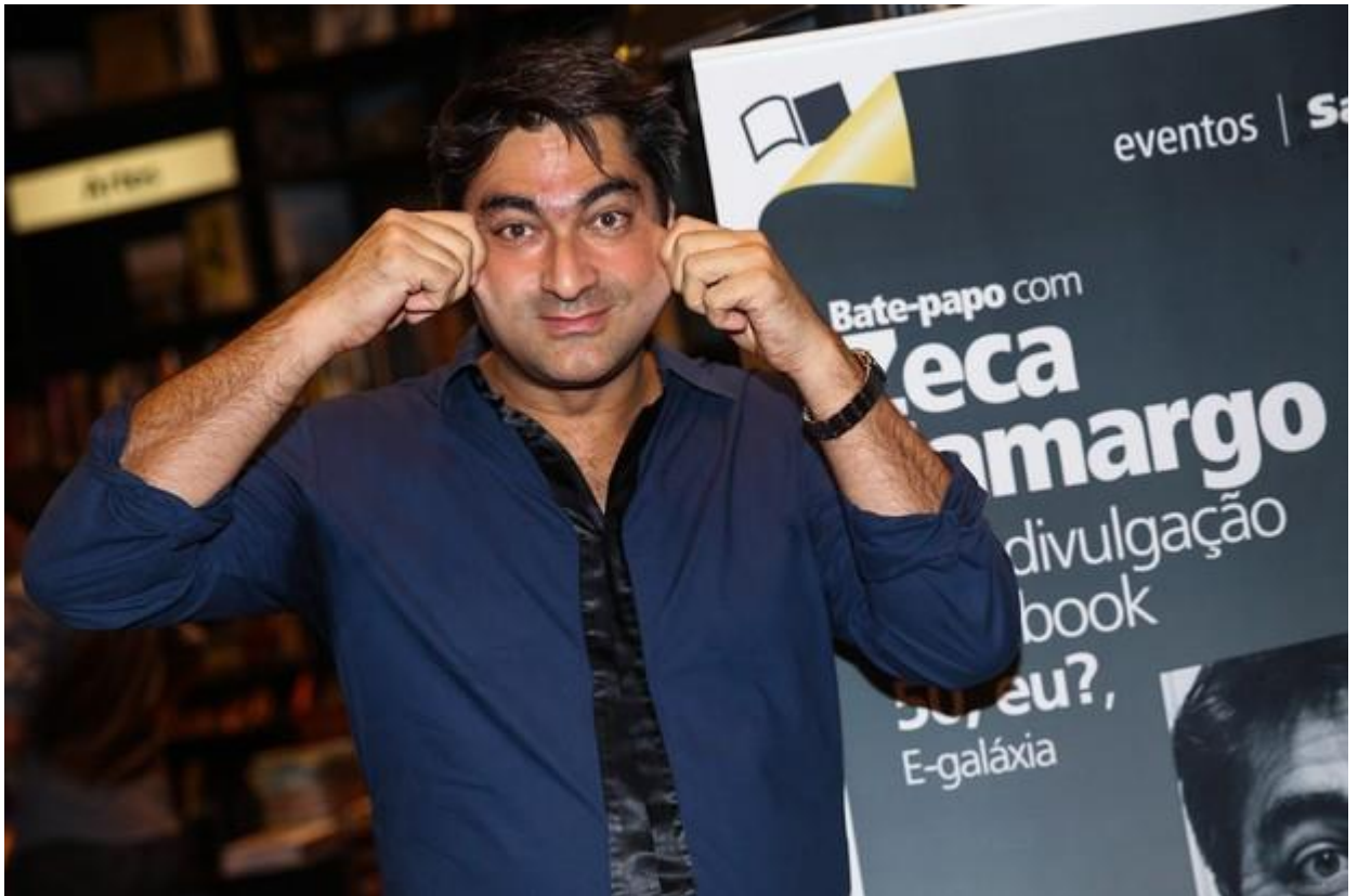
Zeca Camargo